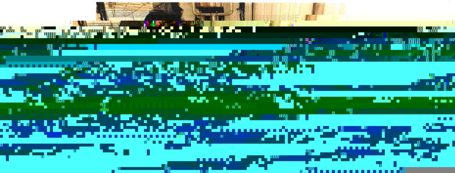
图1：进水超标现场采样